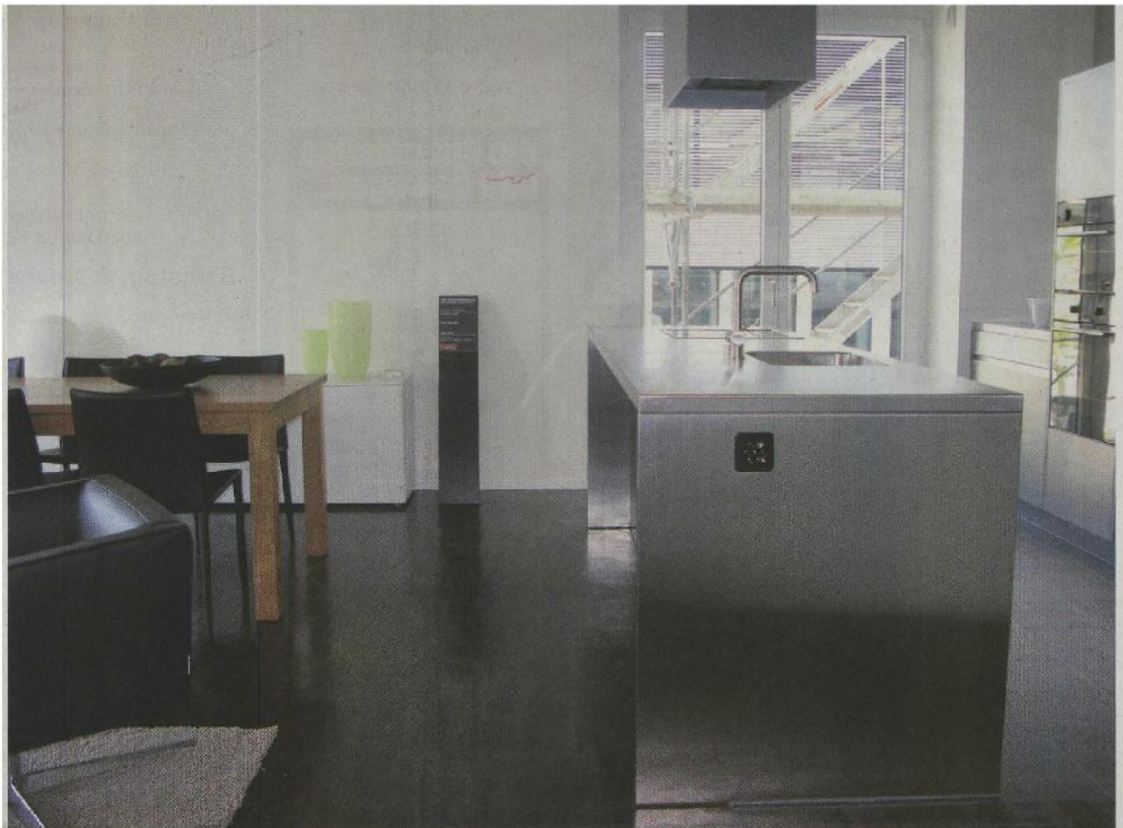
Noch wird emsig gebaut, doch die ersten Musterwohnungen können bereits besichtigt werden.