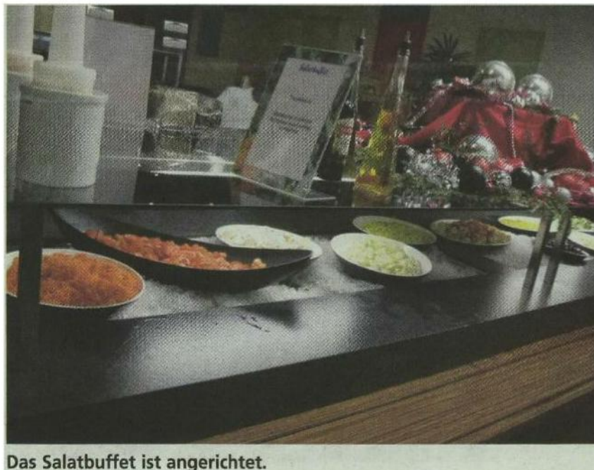
Das Salatbuffet ist angerichtet.