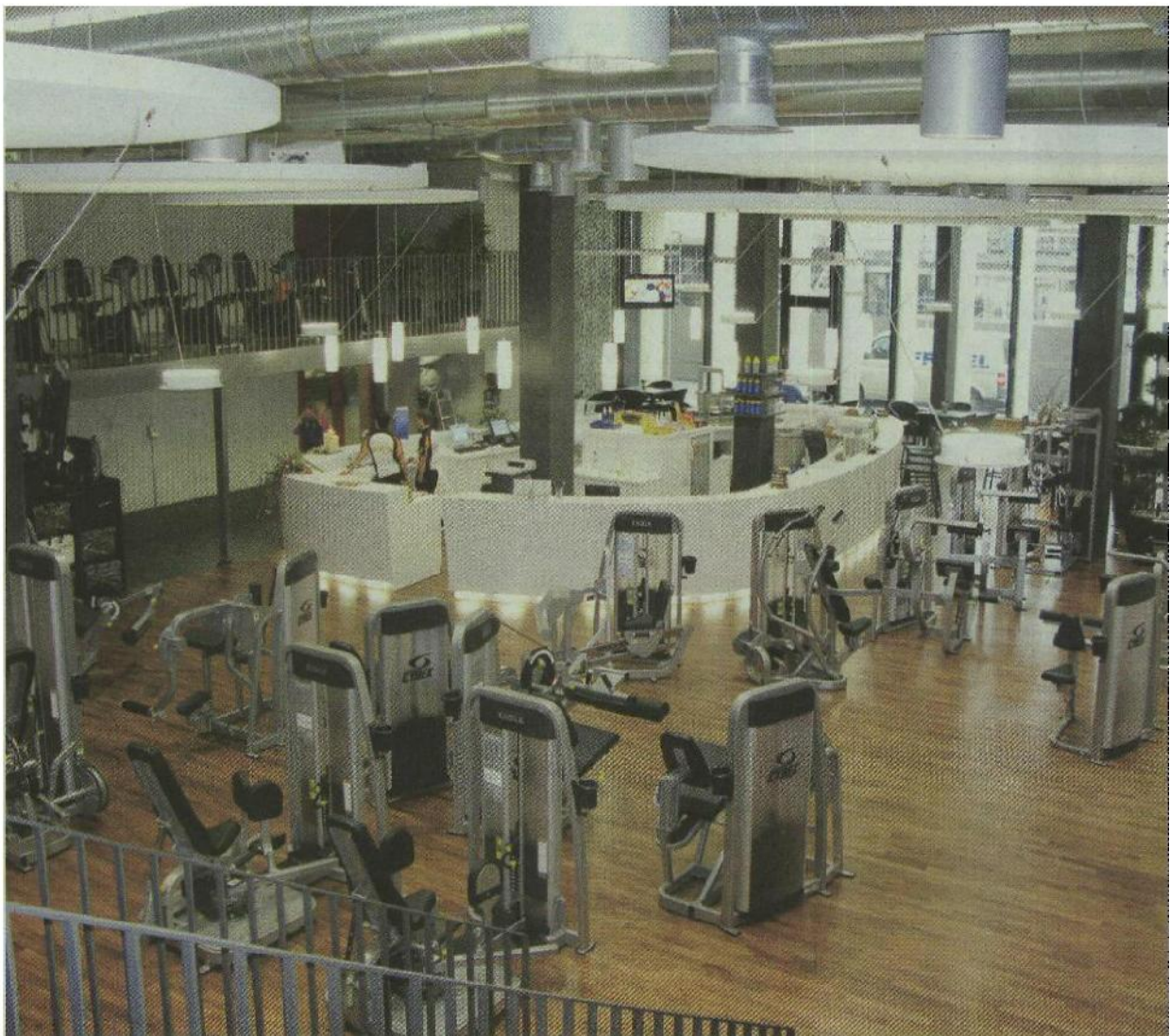
Körper, Geist und Seele sollen im Fitness-Club arena gleichermassen angesprochen werden.

Der Club ist am Montag, Mittwoch und Freitag von 8 bis 22 Uhr, am Dienstag und Donnerstag von 6 bis 22 Uhr und am Samstag, Sonntag zwischen 8 und 18 Uhr geöffnet.