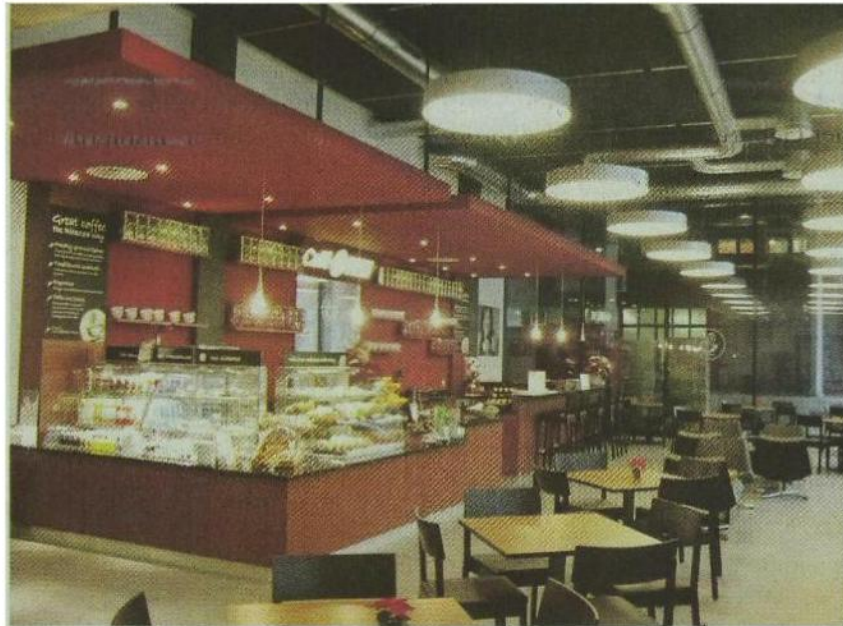
Moderne Einrichtung: Blick ins Restaurant «Square».